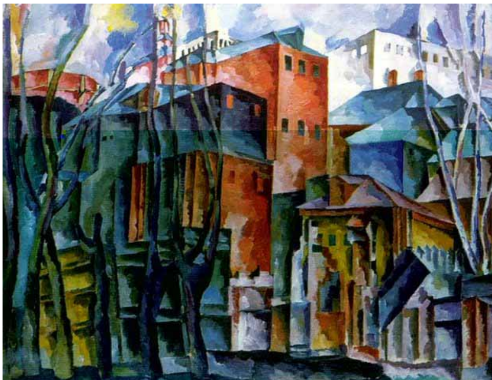
А. Лентулов. Пейзаж с сухими деревьями и высокими домами (Пейзаж с Лаврой). 1920. Х., м. ГРМ

работах того времени. Он пишет Лавру. Но пишет ее, увиденную сквозь сухие деревья: «Пейзаж с сухими деревьями и башенкой (1920). «Пейзаж с сухими деревьями и высокими домами» (1920)... Высокие дома заслоняют Лавру, надвигаются на нее. Тянут мертвые ветки деревьев. Тяжелые, темные краски... Хочется закрыть глаза и не видеть, не видеть ничего, укрыться, уйти.