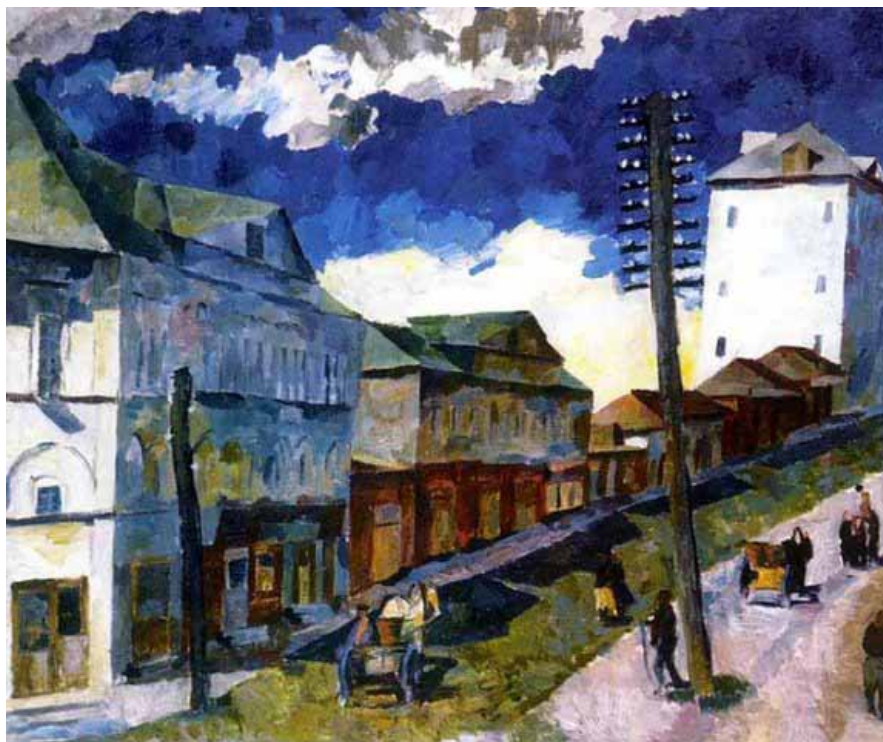
А. Лентулов. Улица в Сергиевом Посаде. 1922. Пензенская обл. картинная галерея

Тяжелым катком проехалось время по художникам, еще недавно молодым и дерзким. Еще долго жили и Аристарх Лентулов, и Илья Машков, и Петр Кончаловский. И так грустно рассматривать их альбомы с репродукциями картин, расположенными по хронологическому принципу.