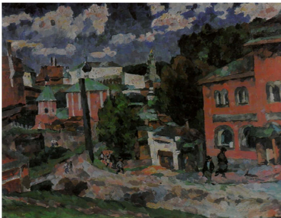
А. Лентулов. Сергиев Посад, 1921. X., м. Гос. картинная галерея Армении

рванными облаками, почти черная листва деревьев, тусклый красный цвет. Не хочется жить в таком городе.