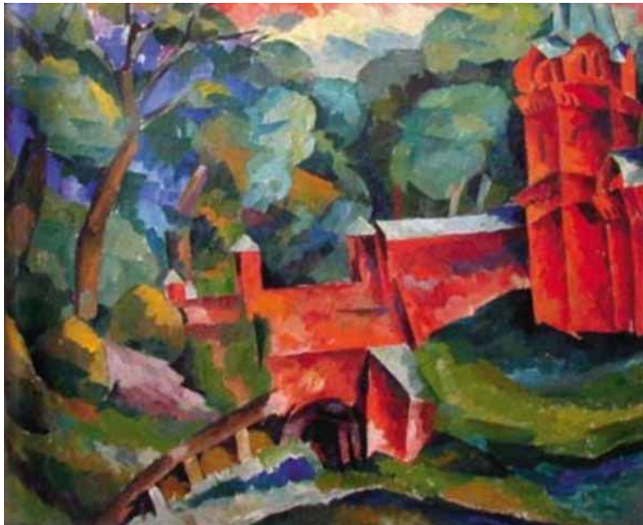
А. Лентулов. У Черниговской. 1919–1920. Х., м. Переславль-Залесский гос. историко-архитектурный и художественный музей-заповедник