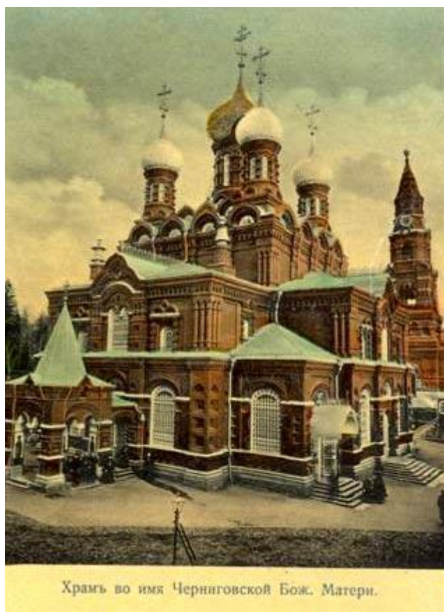
Храм во имя Черниговской иконы Божией. Матери. Открытка начала XX в.

Идеал архитекторов 1860–1970-годов – крестьянская изба. Народничество в общественной жизни, «передвижничество» – в художественной и «ропетовщина» в архитектуре – явления одного порядка. Самые известные имена архитекторов этого периода – В.А. Гартман и И.П. Петров 4 . Пожалуй, больше всего ими было выстроено недолговременных сооружений – выставочных павильонов и т. п. Но и сейчас еще в Абрамцевском музее-заповеднике можно увидеть их постройки – «Студию-мастерскую» и «Баню-теремок».