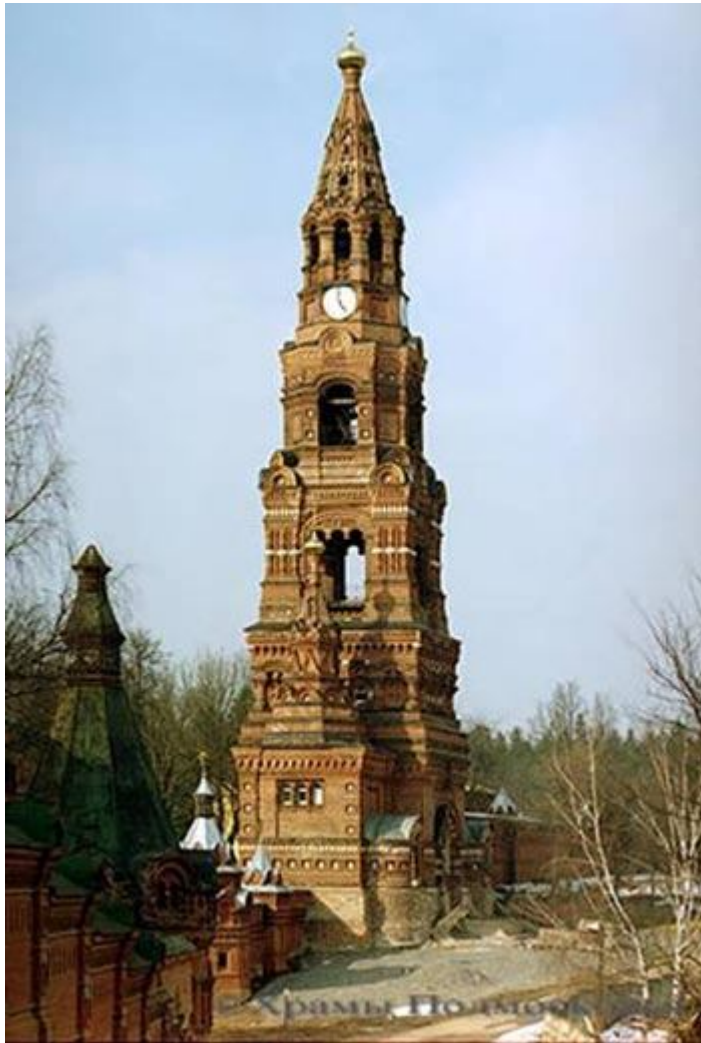
Колокольня Черниговского скита. Открытие начала XX в.

Прежде чем говорить дальше о Султанове и его работе в усадьбе графа Иллариона Ивановича Воронцова-Дашкова, кратко коснусь направления в архитектуре, названного «русским стилем» 2 . Его начало относится примерно к 30-м годам XIX века. Одним из зачинателей был К.А. Тон. Самое известное его сооружение – Храм Христа Спасителя (1832–1883).