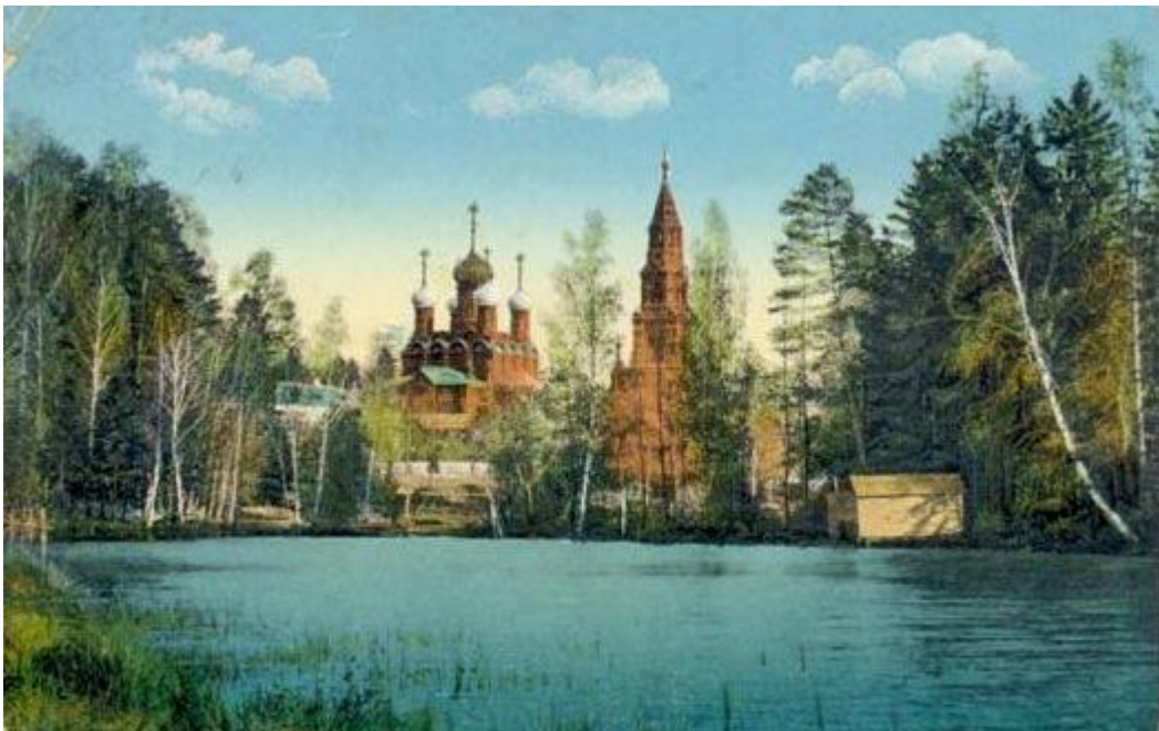
Черниговский скит. Открытка начала XX в.

Обстоятельства сложились так, что потом архитектор должен был переключиться на другую работу. И колокольню строил уже Латков. Но думаю, что он использовал, если не эскизный проект, то какой-то рисунок или набросок Султанова, намеревавшегося создать ансамбль в Черниговском скиту. Иначе не получилось бы такой замечательной гармонии церкви и колокольни.