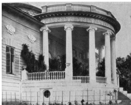
Ротонда садового фасада усадебного дома

Но и природа вокруг была преобразована. Сад, упомянутый в стихотворении П.И. Трубецкого, был создан в старом расчищенном лесу. Е.Н. Трубецкой писал: «...глаз, привыкший к стилю, радовался тут на каждом шагу. Мостики, переброшенные через ручьи, с грациозными перилами в березовой коре, круглая одноэтажная беседка “гриб”, двухэтажная беседка “эрмитаж” с мезонином, с дивным видом с лесистого холма на дом, утопающий в зелени на противоположном берегу реки, пристань для лодок в стиле дома. Весь этот огромный сад с вековыми деревьями, березами, липами, тополями, соснами и елями был раскинут по холмам по обоим берегам реки Вори, запруженной и образующей в Ахтырке широкую водную поверхность с островом посередине, куда мы часто ездили на лодке. Всё это было с любовью и удивительным вкусом устроено моей прабабушкой» 8 .