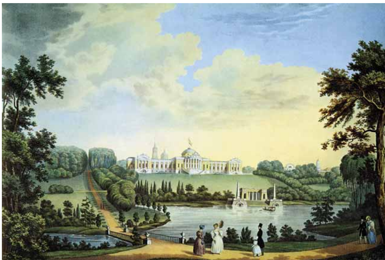
Неизвестный художник. Вид усадьбы Ахтырки. 1830-е гг. Литография

Но пруды требуют ухода, как живые существа. Перефразируя известное высказывание Антуана де Сент-Экзюпери, можно сказать о прудах: мы в ответе за то, что сотворили. Вскоре после отмены крепостного права чистить пруды стало некому. Тогда поэты и художники стали поэтизировать пруды заросшие. Мы видим это на пейзажах В. Серова, И. Левитана, В. Поленова и, конечно, на этюде В. Васнецова «Аленушкин пруд».