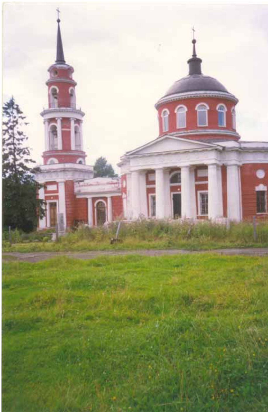
Церковь в Ахтырке после реставрации

На первое место здесь поставлен храм – неременная принадлежность усадьбы. Возведен он был позже усадебного дома – известно, что освящение состоялось в сентябре 1825 г. В усадьбе уже была деревянная церковь во имя явления Ахтырской иконы Божией Матери. И замена ее каменной произошла после строительства усадебного дома.