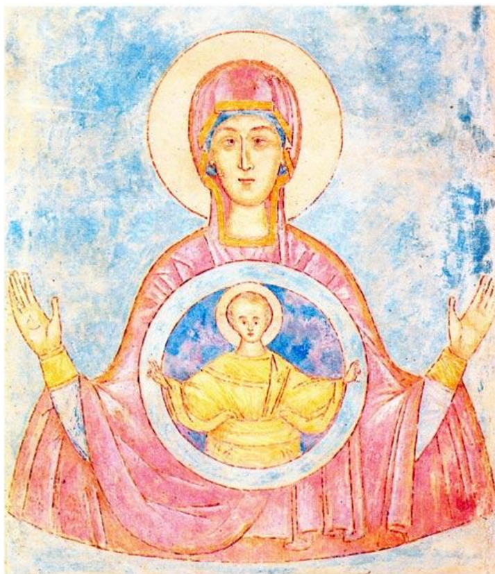
В.А. Комаровский. «Божия Матерь “Знамение”». 1936. Картон, гуашь, белила, акварель. Из церковно-исторического музея Свято-Данилова монастыря