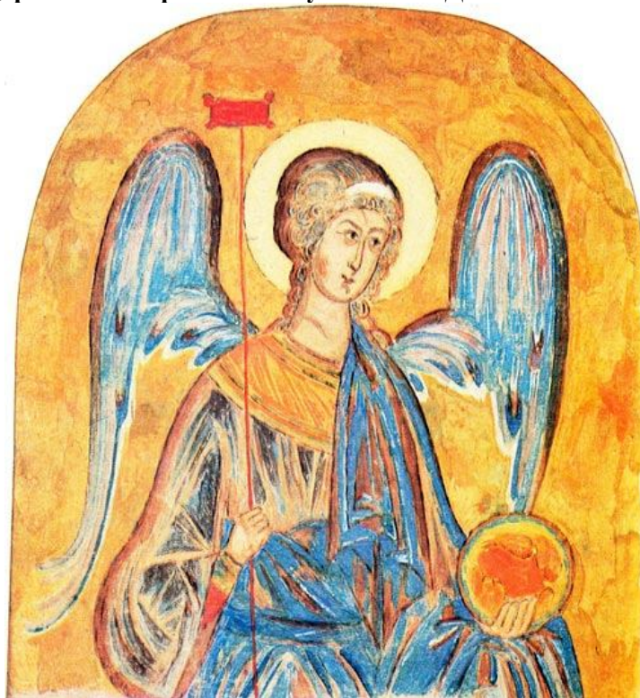
В.А. Комаровский. Эскизы стенописей «Архангел» 1936. Картон, гуашь, белила, акварель. Из церковно-исторического музея Свято-Данилова монастыря