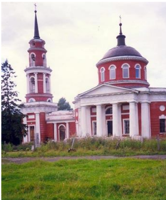
Церковь в Ахтырке. Современное фото.

«...все благие семена посеяны тобою с детства, все наши идеальные стремления исходят от тебя, потому что от тебя все наше сердечное воспитание и все, сколько в нас есть живой любви, душевной теплоты, все эти сокровища внутренней душевной жизни мы первоначально от тебя восприяли» 3 .