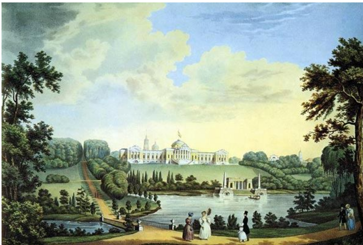
Вид усадьбы Ахтырка. Неизв. худ. Литография 1830-х гг.

бесспорны. Но мы можем предполагать и высокие душевные качества у этой женщины. Ведь где еще есть памятник матери?