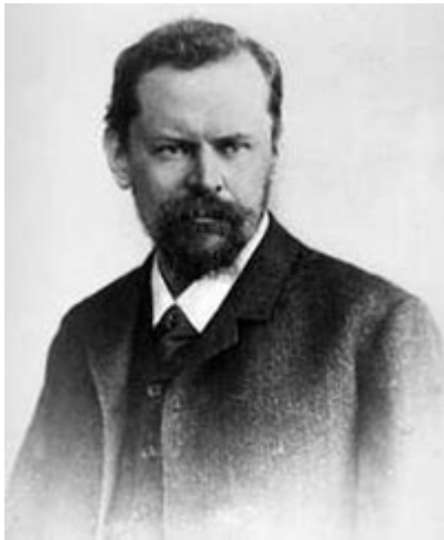
Князь Сергей Николаевич Трубецкой