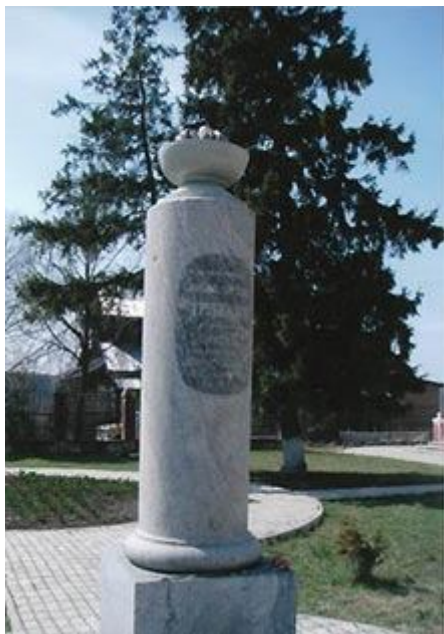
Памятник-колонна княгине Наталье Сергеевне Трубецкой, урожденной княжне Мещерской, установленный в Ахтырке

Это не памятник на могиле – княгиня Н.С. Трубецкая похоронена в Троице-Сергиевой лавре. Нет, этот памятник по распоряжению князя установили на берегу реки Вори в подмосковной усадьбе Трубецких Ахтырке 1 .