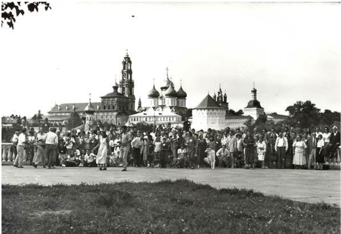
Семейное собрание потомков князя Николая Петровича Трубецкого. 1996 г.