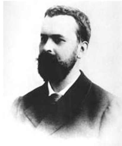
Князь Евгений Николаевич Трубецкой

Воспоминания Е.Н. Трубецкого «Из прошлого» были написаны им в начале марта 1917 года, под лай пулемета и крики революционной толпы на улице. Казалось бы – в самое неподходящее время. Но «связь с дорогими отошедшими должна сохраняться всегда», – вот кредо Е. Н. Трубецкого. И в его воспоминаниях предстает перед нами, прежде всего образ его матери. Если ребенок провинился, ей порою достаточно было лишь взглянуть на него. «Никогда не забуду силы ее гнева, – писал Е.Н. Трубецкой, – когда однажды, бросая пряниками в день ахтырского праздника, я целился ими в головы мальчиков и бросал с силою, причиняя боль. По ужасу, изобразившемуся в ее глазах, я понял, что я сделал... Гипноз этого взгляда сделал для меня третирование крестьянских мальчиков раз навсегда невозможным. <...>