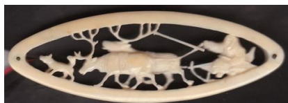
В. Гурьев. Брошка с оленем. Холмогорская резьба, моржовая кость. 1930-е гг.