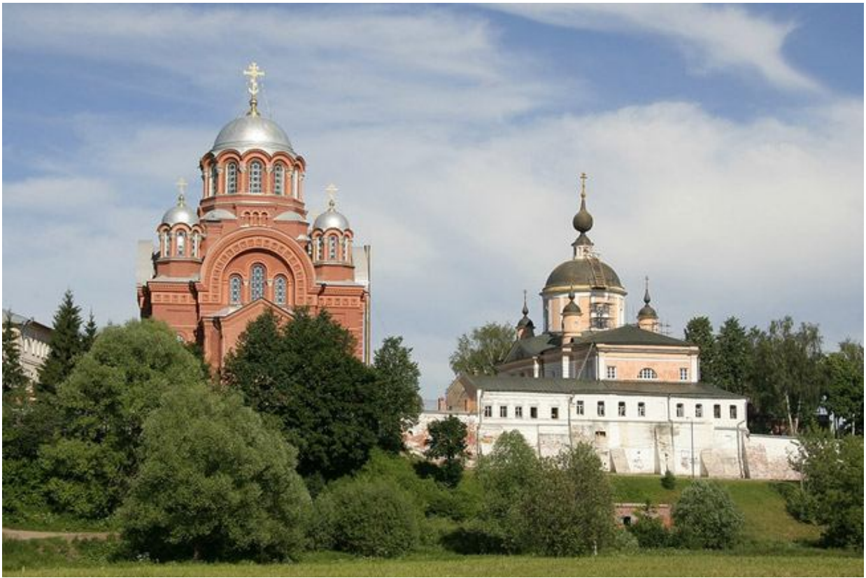
Покровский монастырь в Хотькове

вышивкой монахинь Покровского монастыря в Хотькове, фарфором завода Попова 8 .