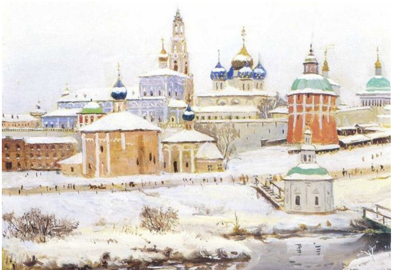
К. Юон. Троицкая лавра зимой. 1910. Х., м. ГРМ

В середине XIX века был создан близ Троице-Сергиевой лавры Гефсиманский скит. Там стремились вернуться к аскетизму церковной службы и всего монашеского обихода: не использовали драгоценные металлы, дорогие ткани. Но скит был закрыт еще в 1928 году 6 . Так где же мог видеть Шергин деревянные подсвечники и берестяные венцы? Это могло быть в северных деревянных церквях, когда он был в фольклорной экспедиции, организованной Архангельским обществом изучения крайнего севера?