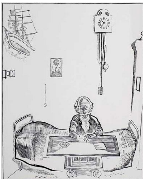
И.В. Голицын. Портрет писателя Б.В. Шергина. Б., линогравюра. 1967

Таким написал Илларион Голицын Бориса Викторовича Шергина (1893–1973) – в полуподвальной комнатке коммунальной квартиры на Рождественском бульваре в Москве. Написал через несколько лет после кончины писателя. Но есть и рисунок, сделанный еще при жизни. И линогравюра по рисунку. А корабль на портрете – модель. Сделал ее отец Шергина – архангельский помор, корабел, певец и художник.