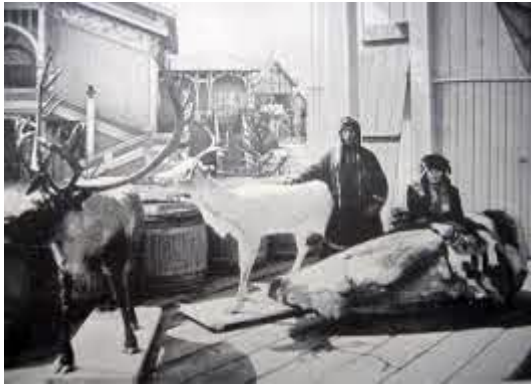
Павильон «Север» на Нижегородской ярмарке

Перенесемся в конец XIX века. Павильон «Крайний Север» Саввы Мамонтова на Всероссийской Нижегородской ярмарке. Мамонтов строит Северную железную дорогу. Нужна реклама.