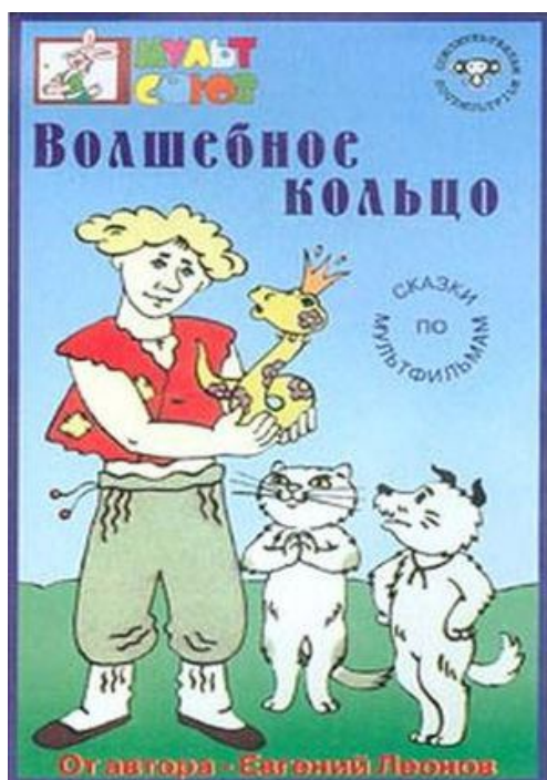
Кадр мультфильма «Волшебное кольцо». Режиссер Л. Носырев