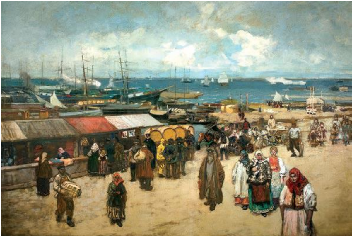
К. Коровин. Базар в Архангельске. Х., м. 1896. Панно для павильона «Север» на Нижегородской ярмарке

Перенесемся в конец XIX века. Павильон «Крайний Север» Саввы Мамонтова на Всероссийской Нижегородской ярмарке. Мамонтов строит Северную железную дорогу. Нужна реклама.