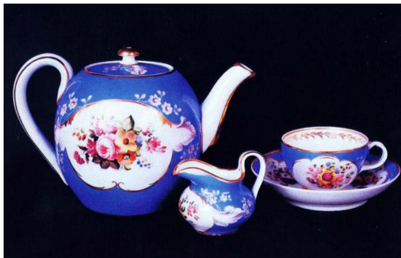
Фарфор завода Попова. XIX в.