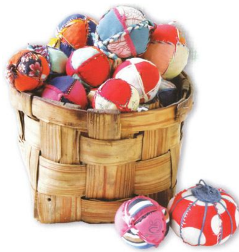
Хотьковские шитые мячики

Но нашлись искусствоведы, которые не просмотрели мастерство местных кустарей-игрушечников. Это, в первую очередь, Галина Львовна Дайн, автор многих замечательных книг об игрушке. Она первая обратила внимание на то, что писатель, живя в Хотькове, восхищался шитой игрушкой и золотошвейной