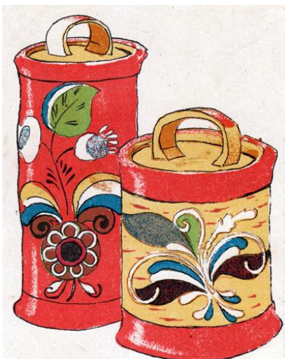
Архангельские тусы берестяные расписные. Почтовая карточка. Изд. Архангельского Общества краеведения. 1925