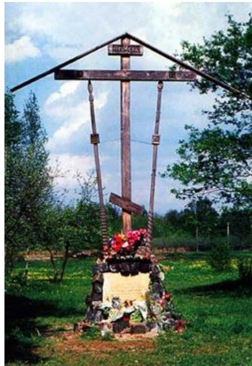
Крест на Бутовском полигоне