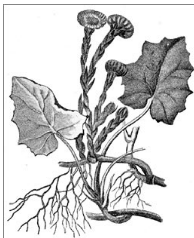
Мать и мачеха