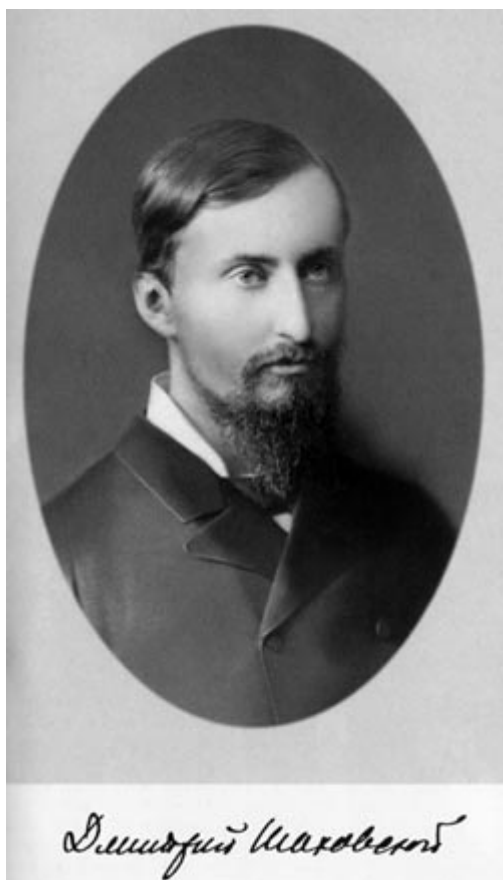
Князь Дмитрий Иванович Шаховской

Период 1918–1928 годов называют «золотым десятилетием краеведения». В ту пору оно было массовым научно-культурным движением. Возглавляло краеведческую работу в стране с 1921 г. созданное в Петрограде Центральное бюро краеведения (ЦБК). Но у организации краеведения в Московской губернии на первых порах были свои особенности.