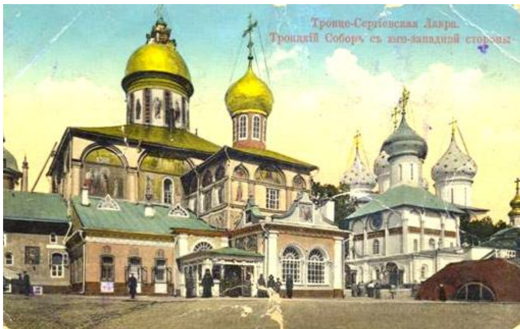
Троицкий и Никоновский соборы Лавры. Открытка начала XX века

занимался своим имением Буйцы в Тульской губернии. Привычка вести хозяйство сохранялась и позже, при работе в Комиссии.