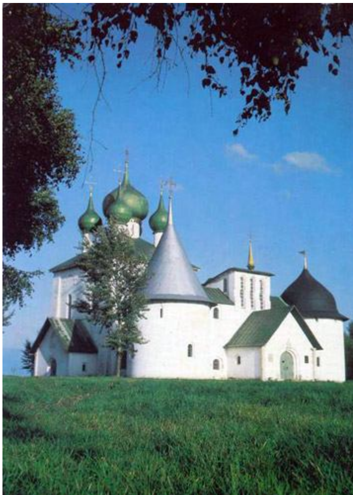
Храм Сергия Радонежского на Куликовом поле. Архитектор А.В. Щусев. Современное фото.

Описью Троице-Сергиева монастыря 1641 г., вкладной книгой 1672 г. синодиком 1575 г., подготавливая их к печати.